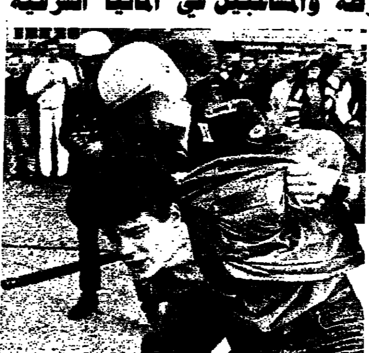
شرطي ألماني شرقي يقبض على أحد مشربي الشب (دويتش) سيرك ولينازارو في الدقيقتين ٦٥ و ٧٩.

في طريقه الى احراز بطولة الدوري الإنكليزي للمرة الثامنة عشرة. استغفام ليفربول اس فريق تنسب اللندي وفاز عليه بنتيجة ٤ - ١. كذلك فاز استون فيلا على ميلوول ١ - ٠. وكريستال بالاس على شاربوتون ٢ - ٠. وتوريث على دربي كاونتي ٢ - ٠. ومانشستر سيتي على ايفرتون ١ - ٠. وكوين بارك رينجرز على شيفيلد ونوتسفام فورتس ٢ - ٠. وتوتنهام على مانستر يونايتد ٢ - ٠. وتغادل وويلدون مع كوفتري صفر - صفر. الدوري الألماني